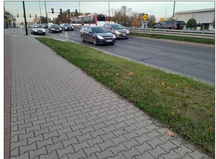
WIDOK OD TABLICY