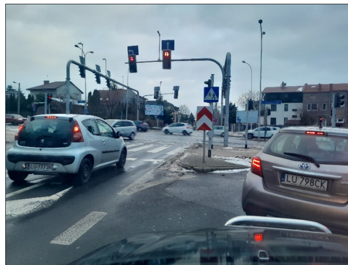
WIDOK OD TABLICY