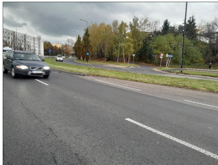
WIDOK OD TABLICY