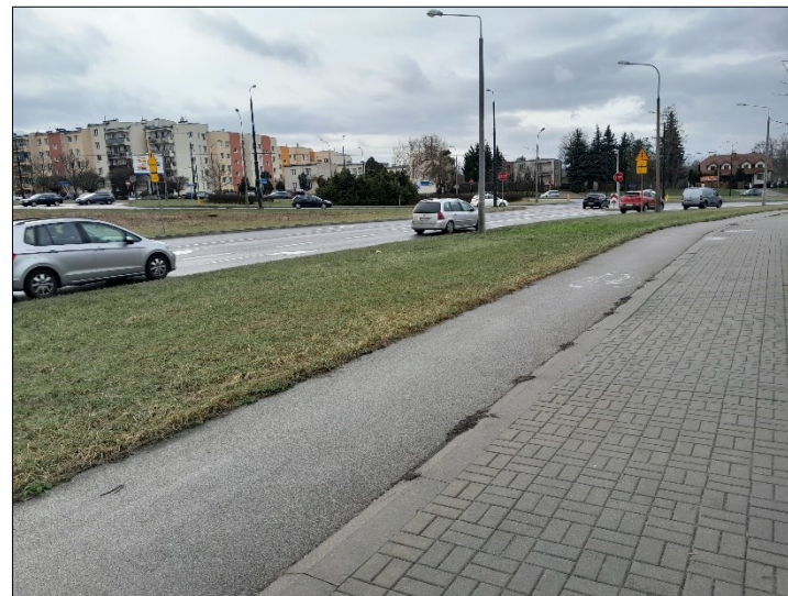
WIDOK OD TABLICY