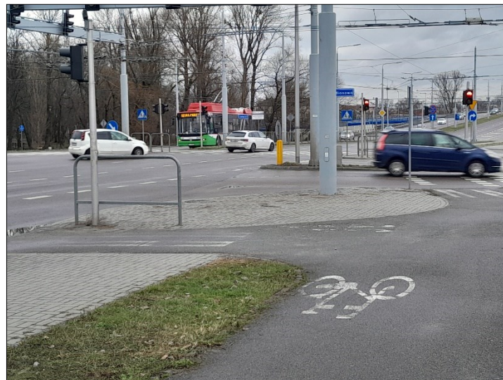
WIDOK OD TABLICY