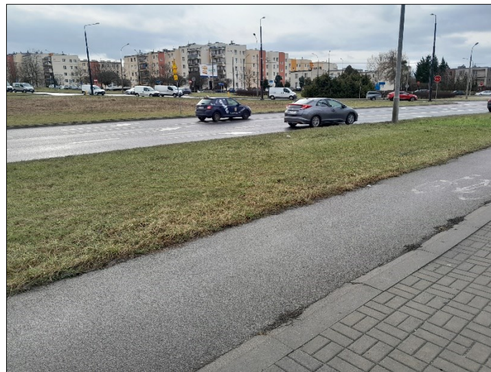
WIDOK OD TABLICY