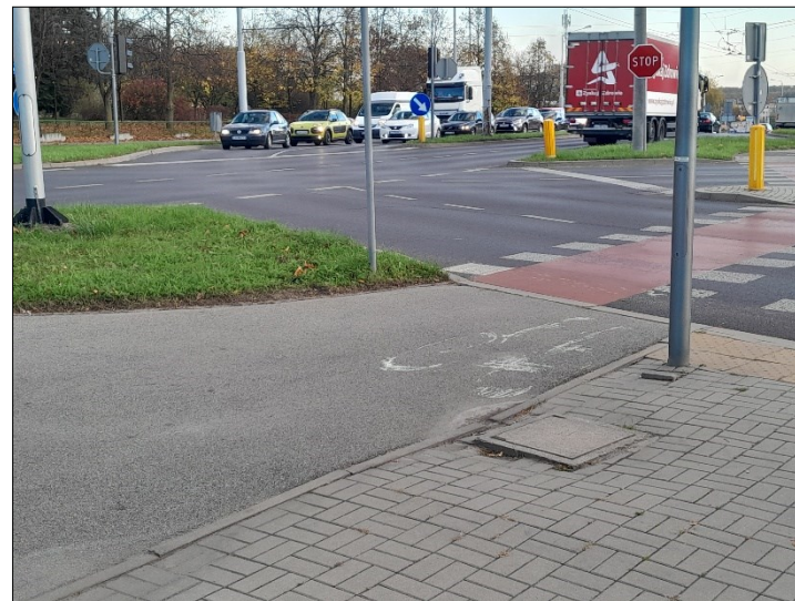
WIDOK OD TABLICY