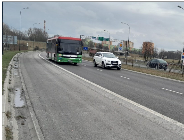
WIDOK OD TABLICY