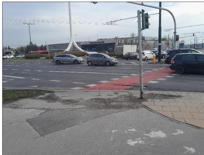
WIDOK OD TABLICY