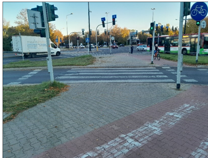
WIDOK OD TABLICY