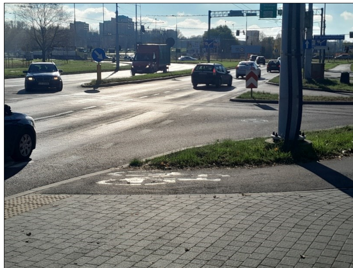
WIDOK OD TABLICY