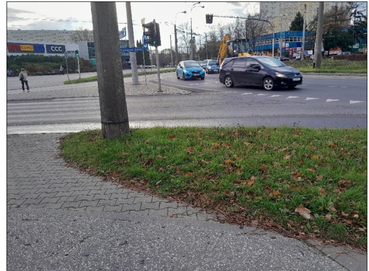
WIDOK OD TABLICY